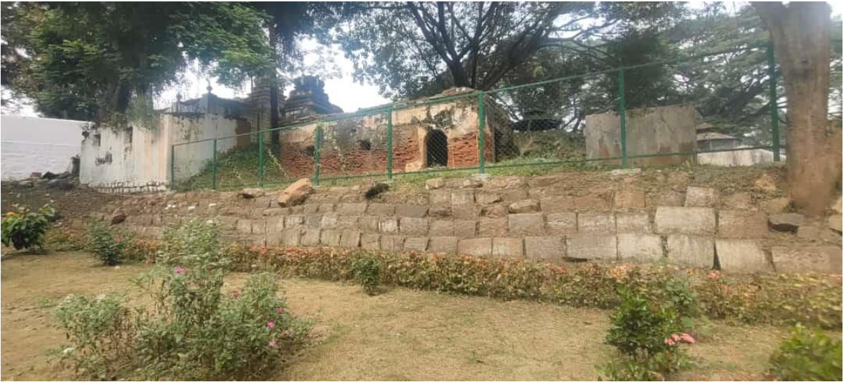
ಶ್ರೀವೀರಾಂಜನೇಯಸ್ವಾಮಿಯ ದೇವಾಲಯ ಪರಿಸರ