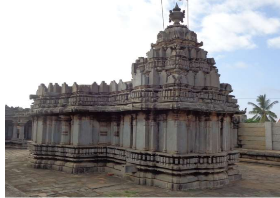
ಹಿಂಭಾಗ ಮತ್ತು ಅಧಿಷ್ಠಾನ